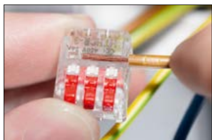
Sul morsetto è contrassegnata la lunghezza di spelatura di 10 mm.

Tutte le dimensioni sono in mm. Soggette a modifiche tecniche. Il minimo ordinabile (MOQ) può differire in base al confezionamento.