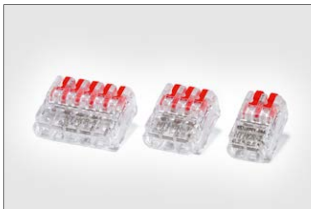
I morsetti HelaCon riapribili sono disponibili per 2, 3 e 5 poli.