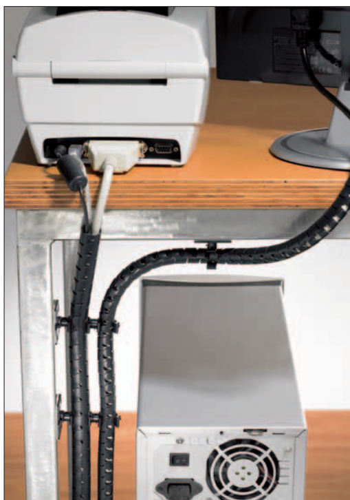
I colori a disposizione si adattano facilmente all'arredamento del vostro ufficio o della vostra casa.

Helawrap pone fine alla confusione dei vostri cavi, a casa e in ufficio. Questa guaina aperta longitudinalmente, flessibile e versatile, organizza e protegge i cavi e i fili dei vostri PC, TV, lettori DVD, Video e Hi-Fi. Installare Helawrap è semplice e veloce. Il disegno unico permette all'utilizzatore di far uscire i cavi da qualsiasi punto della guaina, risparmiando tempo e fatica. Inoltre potete rimuovere e riapplicare Helawrap quando volete.