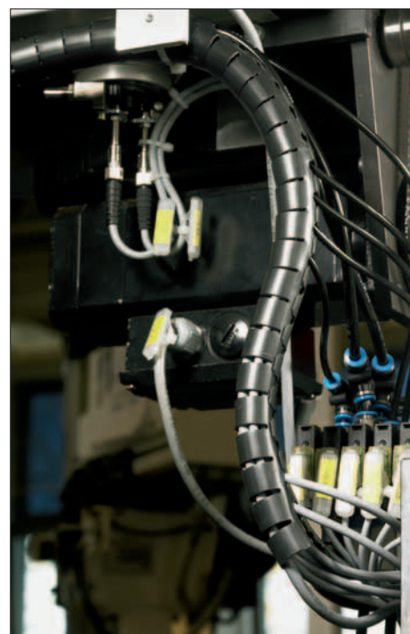
Grazie all'apertura longitudinale i cavi si possono fare uscire da qualsiasi punto della guaina.