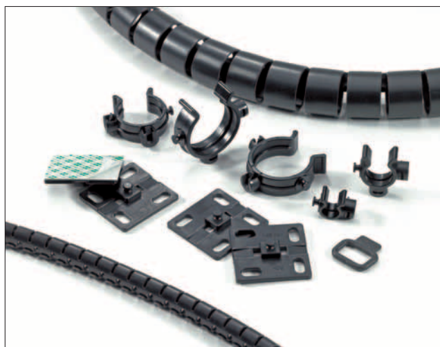
Il set di accessori Helawrap per legare, fissare e proteggere cavi multipli.

Il set di accessori Helawrap con clip e basi possono essere congiunti e danno la possibilità di legare, proteggere e fissare cavi all'interno di macchinari industriali e armadi di cablaggio soprattutto in ambienti dove movimenti e vibrazioni sono sempre presenti. Gli accessori Helawrap sono altrettanto indicati per la protezione dei cavi in ambienti domestici ed in uffici.