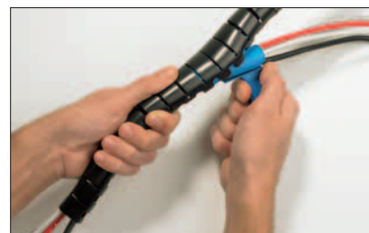
Inserire i cavi facendo scorrere l'utensile applicatore come se fosse una zip.