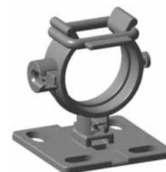
L'occhiello R1 garantisce una tenuta sicura (solo per HWClip25 e HWClip30).