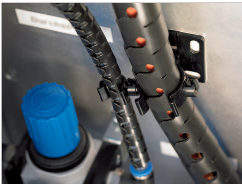
Con il set di accessori Helawrap i cavi possono essere legati, protetti e fissati in armadi di cablaggio e macchinari industriali.

Grazie alla sua resistenza alla fiamma la serie Helawrap HWPA-V0 viene utilizzata in tutti i casi in cui la protezione dal fuoco è essenziale, ad esempio nel settore ferroviario.