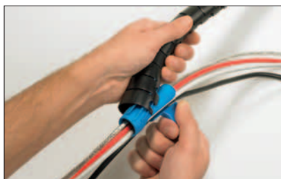
Posizionare l'utensile applicatore ad un'estremità della guaina di contenimento Helawrap.