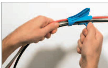
Inserire uno o più cavi nell'apposito foro dell'utensile applicatore.

Tutte le dimensioni sono in mm. Soggette a modifiche tecniche.