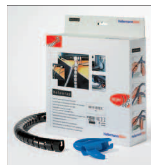
Helawrap, la soluzione semplice e veloce per organizzare i vostri cavi.