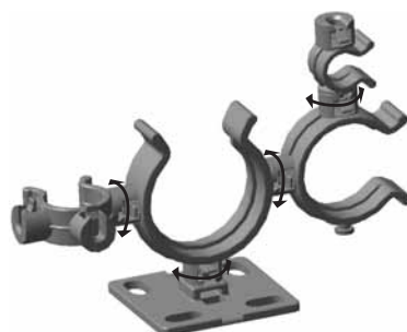
I Clip possono essere agganciati e girati nella posizione desiderata.